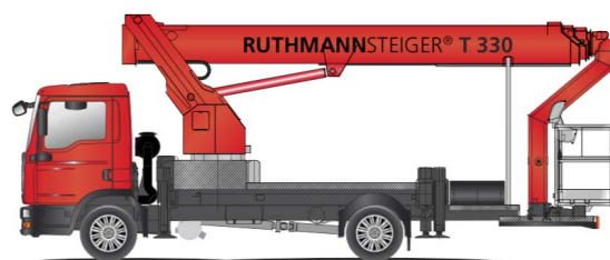
RUTHMANNSTEIGER® T 330 Das Non-Plus-Ultra auf 7,49 t